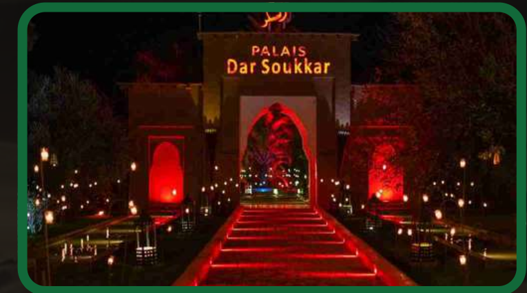
Dîner spectacle au palais Dar Soukkar