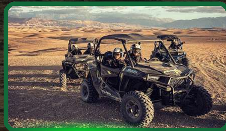
Buggy dans le desert d'Agafay