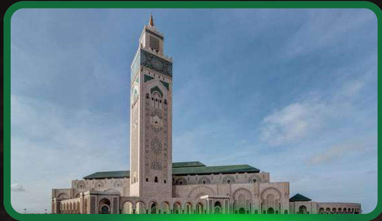
Visite de la grande mosquée de Casablanca