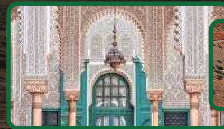
Découverte des cols du haut atlas (2260M) et visite de la demeure du Pasha