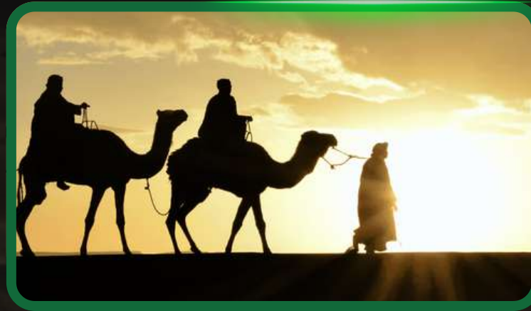
Balade à dos de dromadaire au coucher du soleil