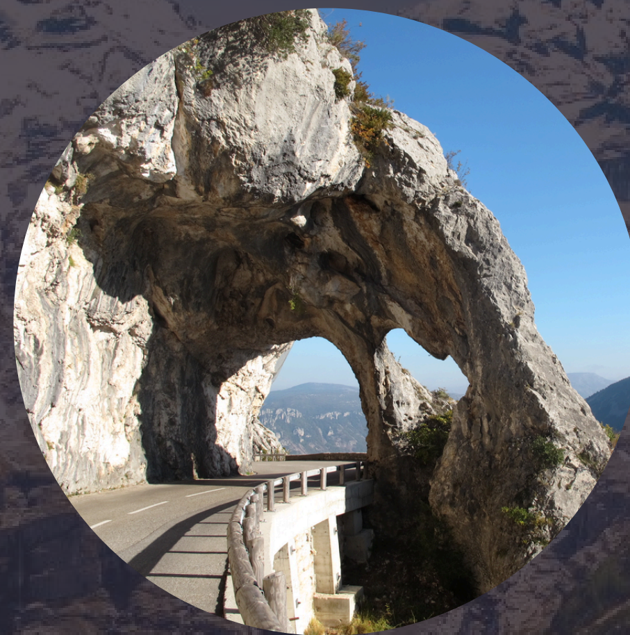
Exploration à travers les cols