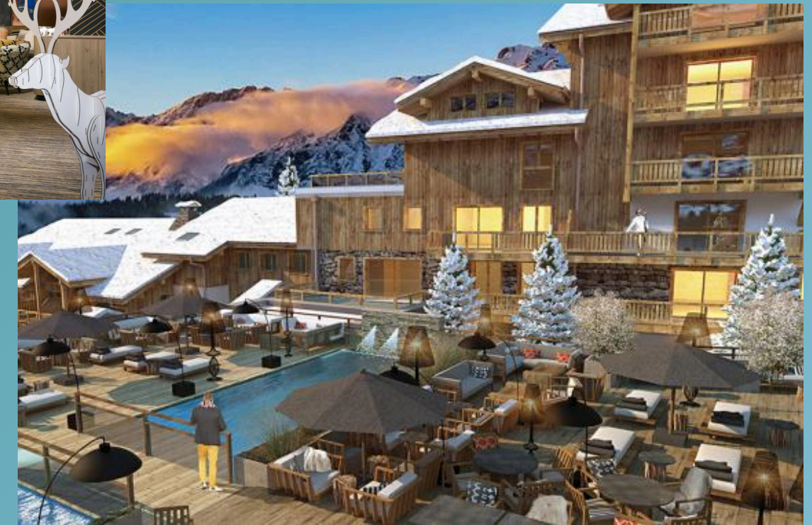
Hotel des Grandes Rousses