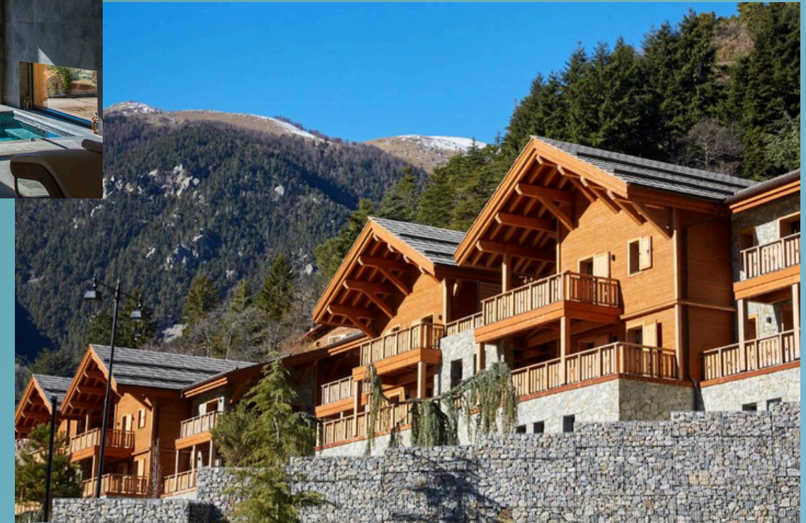
Hotel Pure Montagne