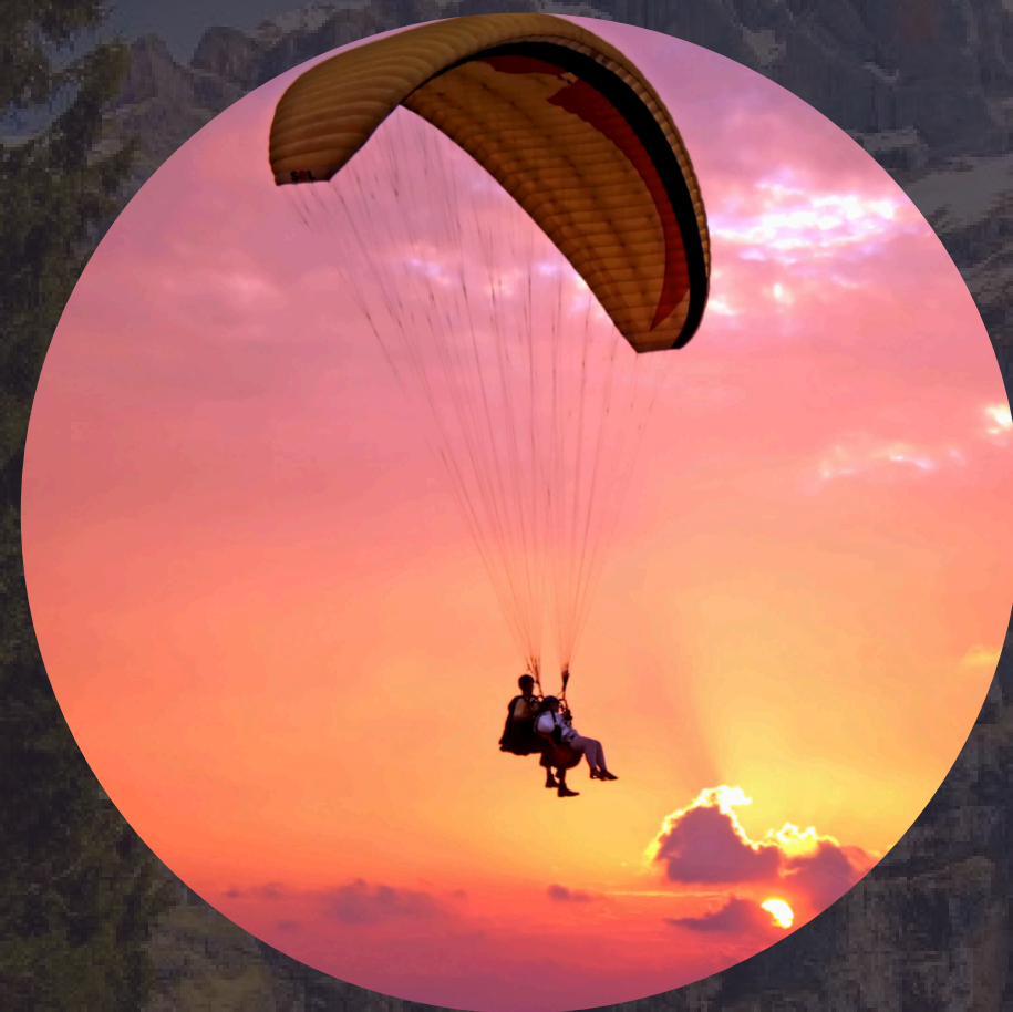
Vol parapente au coucher du soleil