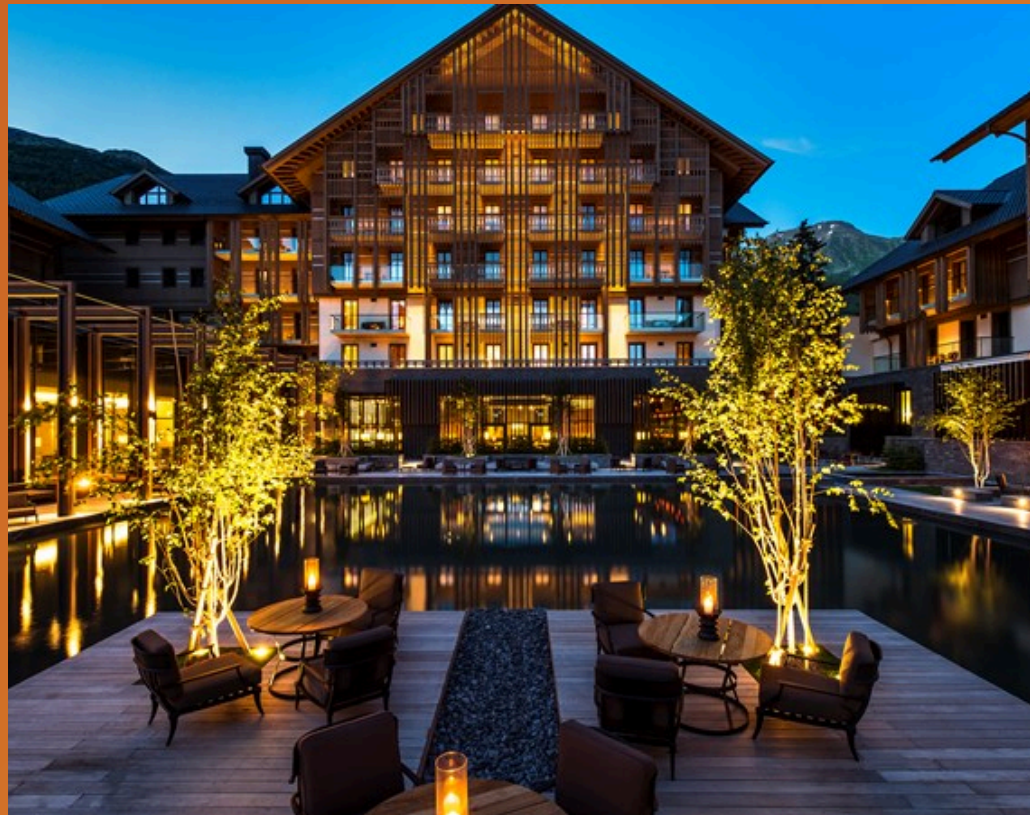
Hôtel The Chedi Andermatt

Situé sur les rives du lac de Côme avec une vue sur les montagnes Suisse