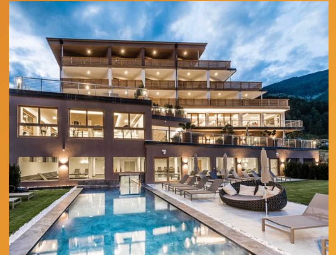
Tuberis Nature & Spa Resort