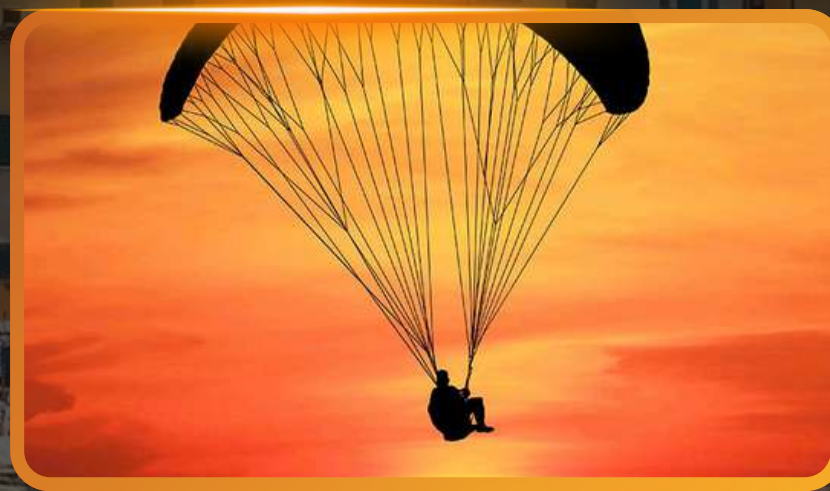
Vol en parapente au levée du soleil