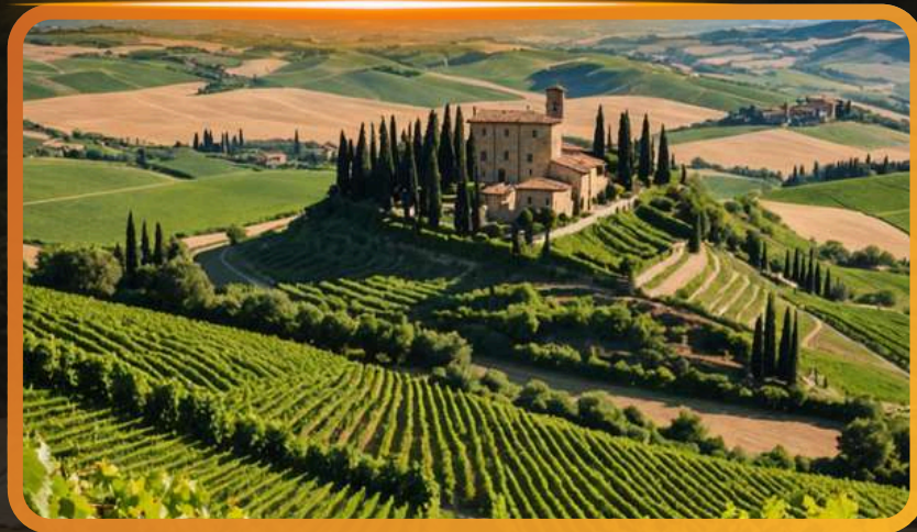
Découverte d'un domaine viticole