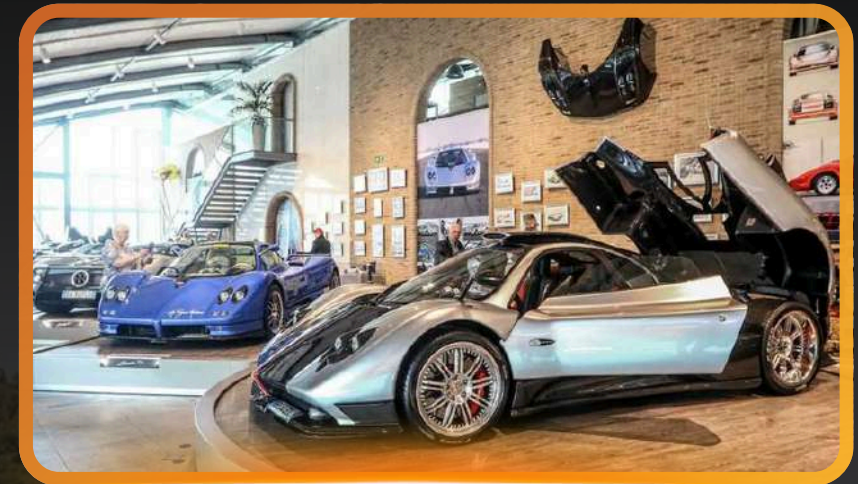
Visite usine et musée Pagan