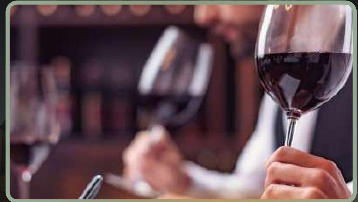
Dans un caveau privé, profitez d'une dégustation de 7 crus